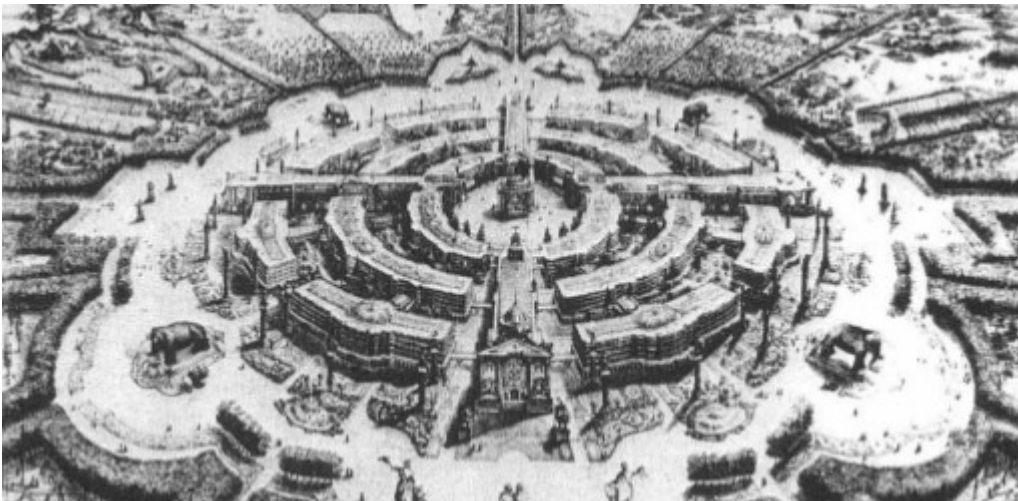
Η πόλη της 6ου Περιόδου του γκαραντισμού (guarantisme) σύμφωνα με τον Φουριέ, 1822

Ο Φουκώ εξήγησε την εμφάνιση του βιοπολιτικού καθεστώτος συζητώντας τα πολεοδομικά σχέδια στα τέλη του 18ου αιώνα όπως το σχέδιο του Rousseau για τη Νάντη (1760). Τα έργα του Perreymond για το Παρίσι που δημοσιεύθηκαν το 1842 και 1843 στην Revue générale χτίστηκαν επάνω σε αυτήν την εμπειρία. Το έργο απεικονίζει το κέντρο της πόλης, αλλά στην πραγματικότητα ασχολείται με το σύνολο της αστικής περιοχής, προκειμένου να αντιμετωπίσει μια σειρά από προβλήματα, όπως η άναρχη δόμηση, η οικονομική ανάπτυξη, η υγιεινή, η εκπροσώπηση, και η ανεργία. Το έργο του Perreymond εισάγει, βασικά, τρεις αποφάσεις. Πρώτον, ενώνει το Île de Cité και το Île Saint Louis σε ένα διοικητικό και πολιτιστικό κέντρο, δίνοντας του, μια δημόσια πρόσοψη ανοικτή στη νέα πλατεία που οραματίστηκε πάνω από το γεμάτο νότιο βραχίονα του Σηκουάνα.